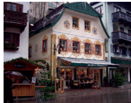
Die bezaubernde Stadt St. Wolfgang war Ausflugsziel für die VB St. Pölten-Stadt.

St. Pölten-Stadt: Am 6. Dezember wurde der Adventausflug der VB mit dem Ziel St. Wolfgang durchgeführt. Das schlechte Wetter konnte der guten Laune nichts anhaben. Die Teilnehmer genossen das bezaubernde Flair der Stadt, wagten eine Schifffahrt auf dem Wolfgangsee und besuchten den Adventmarkt mit den zahlreichen Ständen. Andere wieder lauschten dem Adventsingen mit traditioneller Stubenmusik und dem St. Wolfgangener Viergesang. Nach einem Krippenspiel fand eine Lesung von Gedichten des Heimatdichters Karl Heinz Waggerl statt. Der Höhepunkt des Tages war der Einzug des Nikolaus in Begleitung seiner Engel und der Krampusse. Vom Nikolaus und seinen Engeln wurden Geschenke an die Kinder verteilt, während die Krampusse durch die Gassen streunten und ihr Unwesen trieben.