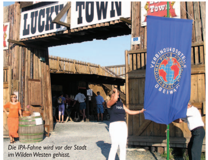
Die IPA-Fahne wird vor der Stadt im Wilden Westen gehisst.

Großpetersdorf: Dass wir eine große Familie mit vielen gemeinsamen Interessen sind, hat sich bei unserem diesjährigen Familienfest in Großpetersdorf wieder einmal gezeigt. Eine tolle Veranstaltung mit fast 200 Teilnehmern, die sich in der kleinen Stadt im „Wilden Westen“ blendend unterhalten haben. Besonders erfreut waren die zahlreichen Besucher über das Kinderprogramm, denn unsere Kleinen durften den Wilden Westen nicht nur hautnah erleben, sondern selbst wirklichkeitsgetreu Cowboy und Indianer spielen. Aber auch für die Eltern gab es ein abwechslungsreiches Rahmenprogramm und der Besitzer dieser nachgebauten Stadt, aus einer Zeit, als Cowboys und Indianer gegeneinander kämpften, hat ebenfalls seinen