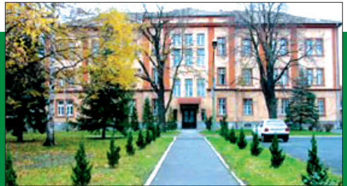
Kommandogebäude der Schulabteilung – das altehrwürdige Gebäude hat schon viele Zeitepochen erlebt.

Die Fachmittelschule für Polizisten und Grenzpolizisten ist in einer aufgelassenen Kaserne an der nördlichen Stadteinfahrt von Sopron untergebracht. Das traditionsreiche Gebäude wurde im Jahre 1889 über Auftrag von Kaiser Franz Josef als Infanteriekaserne errichtet.