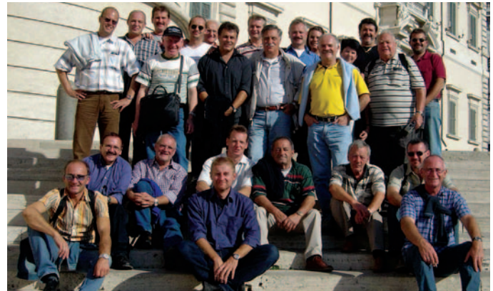
Die Gruppe in Rom.

der Begrüßung ging es ab in Richtung Petersdom. Wir besuchten die Katakomben und am späten Nachmittag das Castel Gandolfo. In einem gemütlichen Lokal in Genzano klang der erste Tag in Rom aus. Das Freitagsprogramm umfasste die Piazza Venezia, Forum Romanum, Kolosseum und nachmittags den Trevi Brunnen, die Spanische Stiege, Piazza Navona sowie die Besichtigung des Pantheons. Vor dem Präsidentenpalast kamen wir gerade zur imposanten Wachablöse zurecht. Der dritte Tag führte uns durch den Borghesegarten zur Piazza del Popolo. Da das Programm doch sehr anstrengend war,