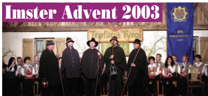
Vorne die Anklöppler, im Hintergrund der IPA-Chor Imst.

gessene Weisen boten das Quintett der Gendarmeriemusik Tirol, die Anklöppler aus Strass im Zillertal, die Familienmusik Schöpf aus Längenfeld, der Matrierer Viergesang aus Matrie