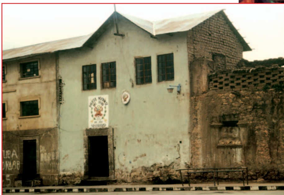
Triste Verhältnisse für Perus Polizei. Im Bild eine Polizeistation in der Vorstadt.

Die Probleme der Kriminalität und innere Sicherheit betreffen die verschiedenen grundsätzlichen Prozesse zur demokratischen Stabilität unserer Länder. Folglich werden die Politik und die Strategien gegenüber dem Verbrechen in Lateinamerika einen entscheidenden Schritt zur Reform und Modernisierung des Staates bilden.