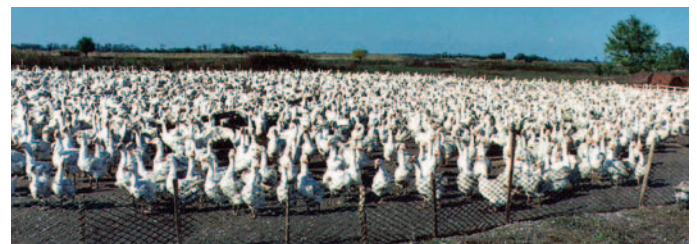
Gänsefarm in der Hortobagyi-Puszta.

Es gab ein tolles Rahmenprogramm mit einer Ballettvorführung von Schulkindern. Operettensänger aus Budapest sangen die bekanntesten Melodien aus dem Zigeunerbaron und der Csardasfürstin und ein in Ungarn allseits bekannter Komiker brachte das Publikum durch seine Witze zum Lachen. Bis in den frühen Morgen