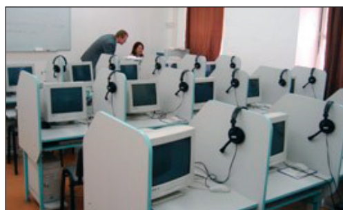
Bild links: Schüler im Training für die Verkehrsregelung. Bild rechts: Mit modernster Technik werden die Lehrgangsteilnehmer auf ihre kommenden Aufgaben vorbereitet – zum Sprachstudium werden Computer verwendet.