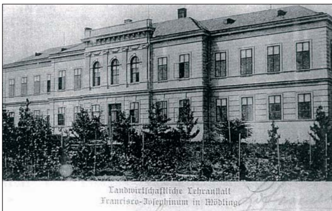
Landwirtschaftliche Lehranstalt Francisco-Josephinum in Mödling

den inneren Dienstablauf und den Kontakt mit den BZS. Das architektonisch anspruchsvolle und mit allen Schikanen der modernen Kommunikationstechnik ausgerüstete Gebäude beherbergt nicht nur Grundausbildungslehrgänge, sondern auch Lehrgänge für dienstführende Beamte und Kriminalbeamte, sowie Kurse für die allgemeine Verwaltung. Zur Umschulung von Zollwachebeamten, die zur Exekutive optierten, gibt es eigene Einführungskurse. Auch die Mautaufsichtsorgane der ASFINAG erhielten ihr Wissen in Traiskirchen. Zahlreiche Seminare und Führungskräftelehrgänge, die in Modulen abgeführt werden, runden den Aufgabenbereich des BZT ab. Besonders stolz ist man, dass in dem Areal auch das „Ad hoc Centre for Border Guard Training“, in dem nationale und internationale Experten die Harmonisierung der europäischen Grenzpolizeiausbildung erarbeiten, sowie die Zivilschutzschule untergebracht ist. Zur Zeit drücken hier über 200 Beamte die Schulbank. Sie besu-