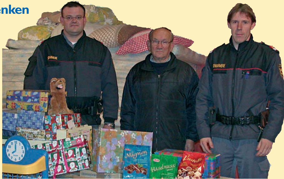
Mit diesen Süßigkeiten wollte man den Kindern eine Freude machen – schade, die Bürokratie war stärker.

„vermeintlichen Weihnachtsmänner“ mit zwei voll beladenen Kleintransportern in Richtung Ukraine auf. Doch man hatte weder die politischen Unruhen im Land selbst, noch die Bürokratie der ukrainischen Behörden bedacht. Der Amtsschimmel wieherte. Obwohl alle Einreiseformalitäten vorhanden waren, durfte der Konvoi in die Ukraine nicht einreisen. Selbst zahlreiche Interventionen nützen nichts – Eisblöcke sind eben nicht zu brechen – und das schon gar nicht im Winter. An der Grenze war Endstation.