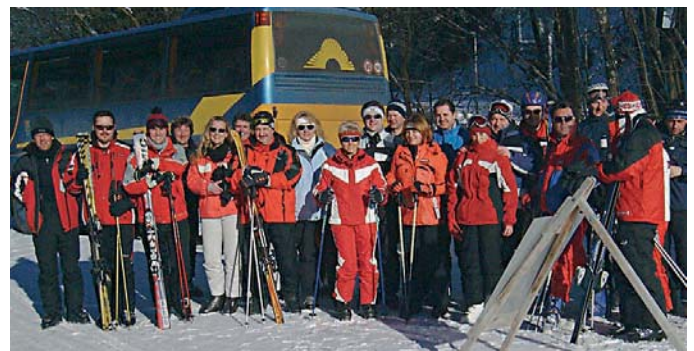
Man sieht es - tolles Wetter, gute Stimmung

Eisenstadt-Stadt: 25 KollegInnen, durchwegs Angehörige der BPD Eisenstadt, unternahmen im Feber einen Ausflug ins „Schiparadies für Flachländer“, auf das Stuhleck. Dass auch wir Burgenländer gute Schifahrer sind, hat sich an diesem Tag gezeigt. Bei ausgezeichneten Pistenverhältnissen, aber trübem Wetter, kamen wir ganz gut zurecht. Je länger der Tag dauerte, umso öfter „verblies“ uns der Wind in Richtung Schihütte, wobei uns