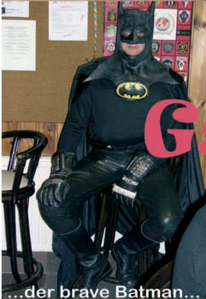
...der brave Batman...