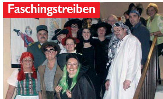
Angeführt von einer Hexenschar trafen sich Pirat, Scheich, Fliegenpilz, Hänsel & Gretel und allerlei Phantasiefiguren im Vereinslokal St. Pölten.

St. Pölten: Am 2. Februar ging es bei der VB St. Pölten-Stadt hoch her: