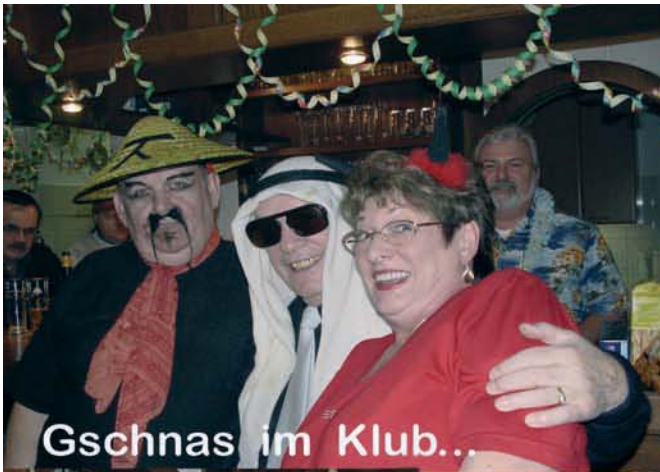
Gschnas im Klub...