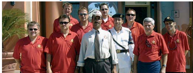
Eine gut gelaunte Mannschaft vor dem Hotel mit ägyptischen Sicherheitskräften.

Jennersdorf: Kürzlich begaben sich zehn Kollegen der IPA aus dem Bezirk Jennersdorf auf ein Tenniscamp nach Ägypten. Ziel der Reise war der Magic-Life-Club Sharm El Sheikh. Ein wahres Paradies an der Südspitze der Sinai Halbinsel am Roten Meer, direkt am herrlichen Sandstrand, nur etwa 10 km vom Flughafen Sharm El Sheikh entfernt.