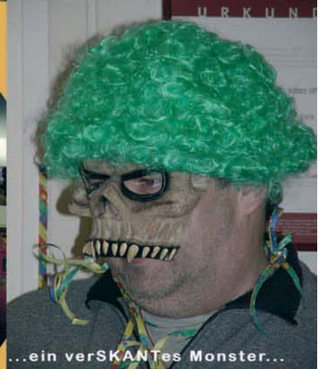
...ein verSKANTes Monster...