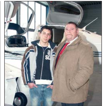
Die IPA Gruppe hatte die seltene Möglichkeit das Flugzeugwerk Diamond Aircraft in Wiener Neustadt zu besichtigen.

Wiener Neustadt: Im Zuge der Jubiläumsfeier von der Verbindungsstelle Bruck an der Mur besuchte die Gruppe das Flugzeugwerk Diamond Aircraft