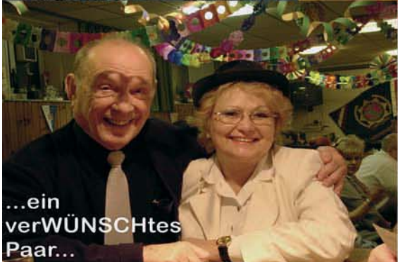
...ein verWÜNSCHtes Paar...