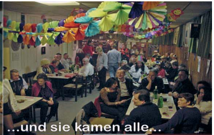
...und sie kamen alle...