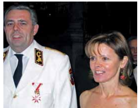
Weißer Polizeiuniform, wohl das letzte Mal