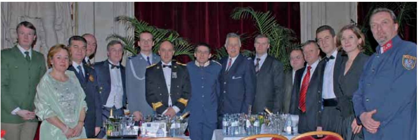
Polizeikollegen aus den umliegenden Ländern zu Besuch beim Polizeiball und bei der IPA LG Wien

Wie ersichtlich war der Polizeiball 2008 ein toller Erfolg, nicht zuletzt wegen der Unterstützung durch die IPA LG Wien. Die Eröffnung tanzten gemeinsam Rumänische und Wiener Polizistinnen und Polizisten. Neben den umfangreichen Gästebetreuungen sei auch die Fotopräsentation mit aktuell geknipsten Bildern während der gesamten Veranstaltung durch den EDV Referenten Franz 3. und seiner Helfer erwähnt.