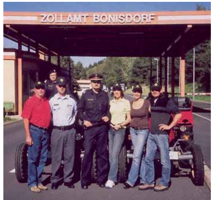
Eine schöne Fahrt in blühender Natur ist zu Ende