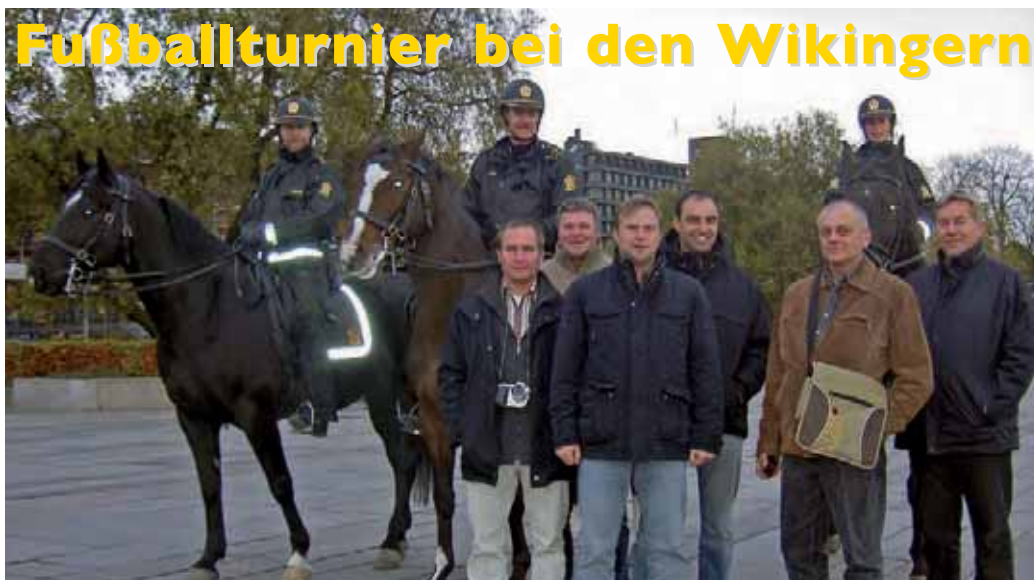
Stadtbummel durch Aker Bryge begleitet von der örtlichen Polizei entlang der autofreien Uferpromenade.