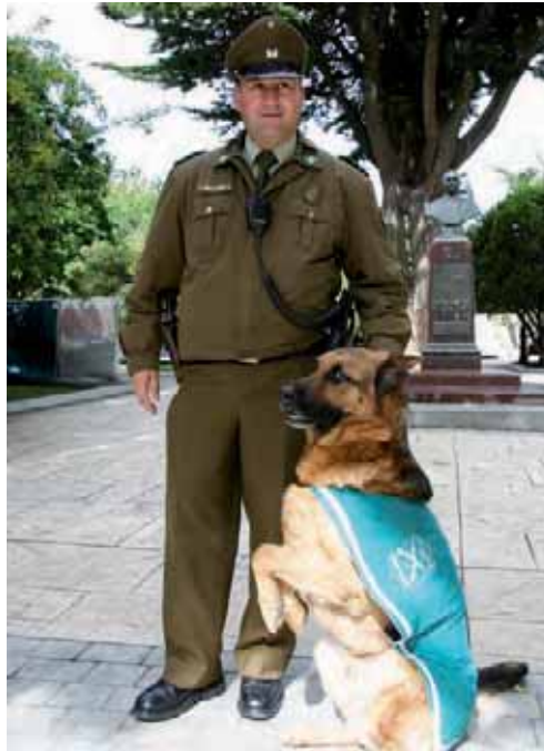
Hundeführer in Punta Arenas. Polizeihunde haben im Dienst Uniform zu tragen.

ZITAT: Danke denen die schlaflos wachen. Ihr seid ohne es zu wissen die Wächter unseres Schlafes und das Gewissen der ganzen Stadt.