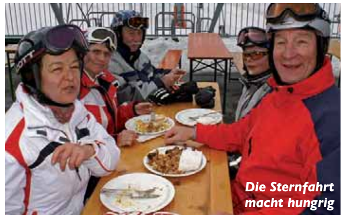
Die Sternfahrt macht hungrig

Der erste Skitag war jedoch vom Winde verweht. Ein starker Orkan zwang die Liftbetreiber den Betrieb sämtlicher Anlagen einzustellen. So verbrachte man den Tag unter Freunden mit Spielen und dem Austausch von Erlebtem. An den folgenden Tagen kam keine Langeweile auf. Neben dem Schilauflauf auf schönen und gut präparierten Pisten in gesunder Luft und sauberer Natur konnten die Gäste beim „Gröstlessen“ und dem Genuss weiterer kulinarischer Köstlichkeiten auch die Vorzüge der „Kärntner Kuchl“ kennen lernen. Einer der Höhepunkte der Skiwoche