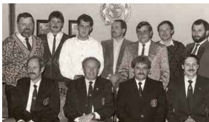
Foto links: Unser Ehrenmitglied bei der Gründungsfeier vor 23 Jahren