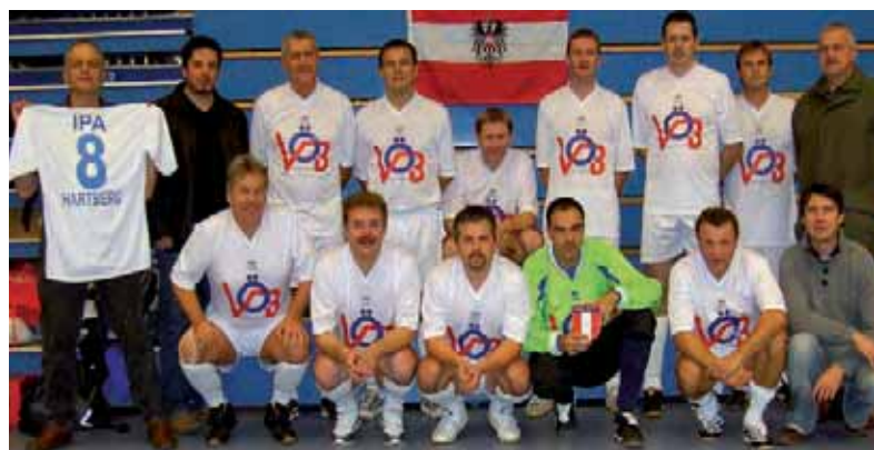
Fußballteam der VB Fürstenfeld-Hartberg