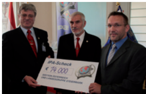
Bild rechts: Spendenübergabe in der Alten Universität in Graz zur Sanierung des Hauses der Exekutive.