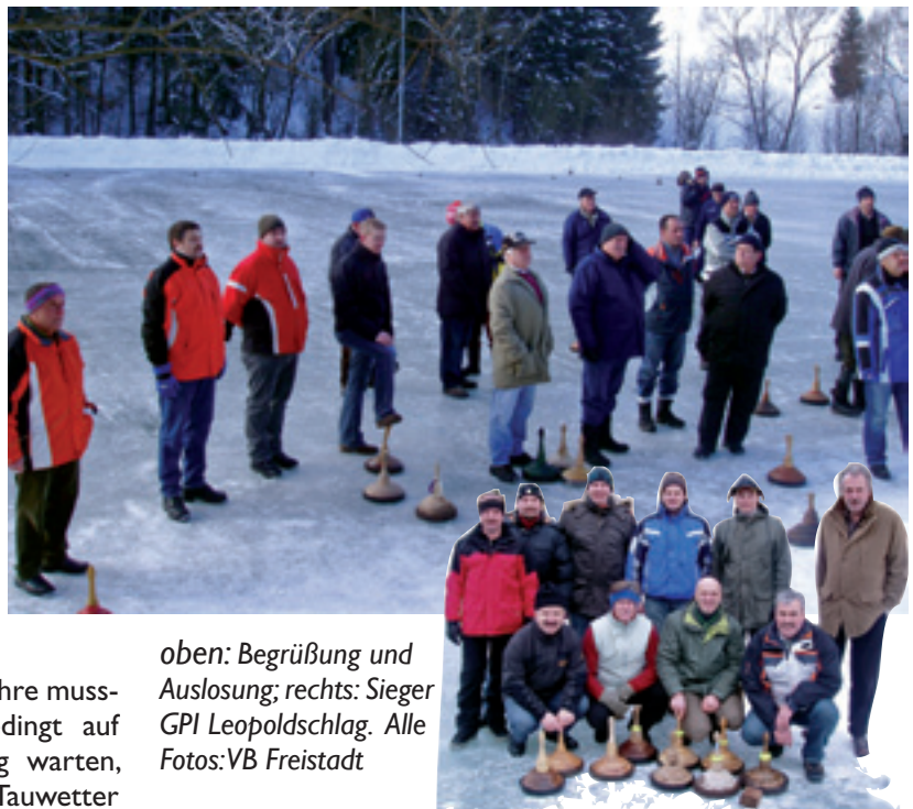
oben: Begrüßung und Auslosung; rechts: Sieger GPI Leopoldschlag.