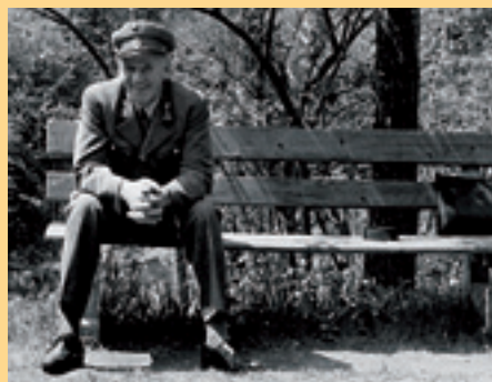
patroulierender Gendarm bei der Rast.