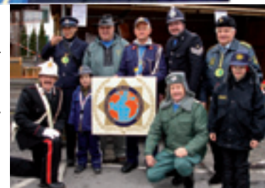
rechts: die fleißige IPA Mannschaft nach getaner Arbeit.