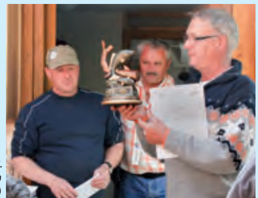
Siegerehrung.