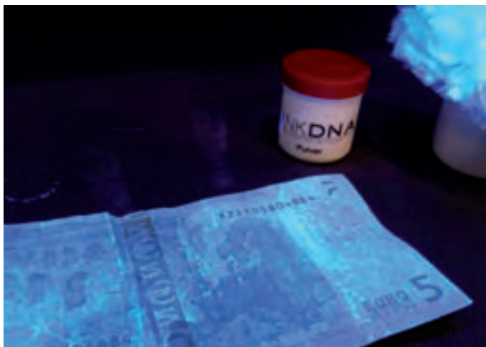
Ein mit LinkDNA Pulver bestaubter Geldschein unter UV Licht.