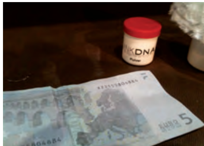
Der gleiche Geldschein, ebenfalls behandelt. Doch ohne UV-Licht ist nichts erkennbar.

ständig von der Haut oder Gegenständen zu entfernen. Lediglich bei der Anwendung der LinkDNA Täter Markierung werden UV Farbmarker verwendet um eine schnelle und einfache Fahndung durch die Exekutive zu ermöglichen.