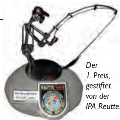
Der 1. Preis, gestiftet von der IPA Reutte.