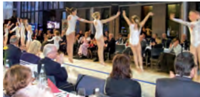
Showeinlage der Kinder.