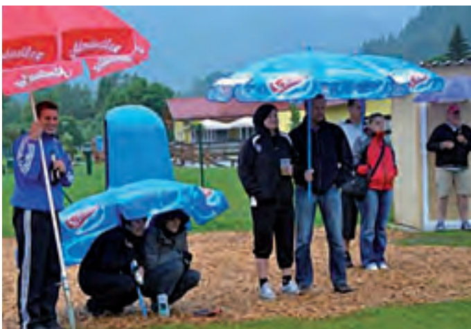
Die Zuseher gut beschirmt im Regen.