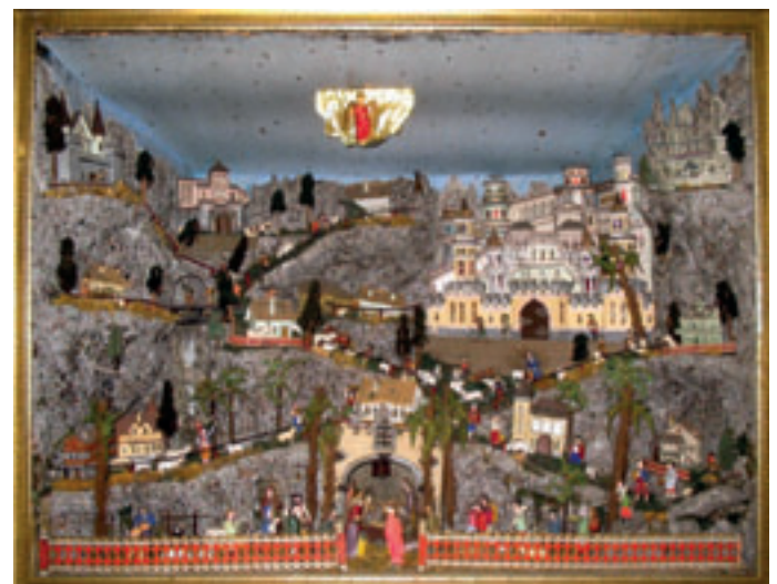
Von Hennerbichler restaurierte Gulichkrippe von 1840. Der Krippenberg ist aus Papiermaschee und die Gebäude aus Karton gefertigt. Bei allen Leimstellen musste Warmleim (Perlleim) verwendet werden. Die Figuren sind original geschnitzte Grulich Darstellungen. Orientalische Eckkastenkrippe, Breite 72 cm, Höhe 38 cm, Tiefe 25 cm.

Die Krippe ist jetzt in Lipót -Region Győr - im Gemeindeteich vor seinem Wochenendhaus verheftet. Die Segnung durch den Dorfpfarrer war ein enorm großes Fest, bei dem der Bürgermeister und alle Gemeindepolitiker anwesend waren. Wie berichtet, unter den Ehrengästen waren auch mehrere Vertreter von ungarischen und österreichischen IPA-Organisationen.