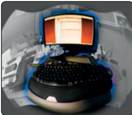
Filmpiraterie Seite 13