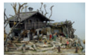
oben: Heimatliche Krippe auf einer Grundplatte von 70 cm x 40 cm.