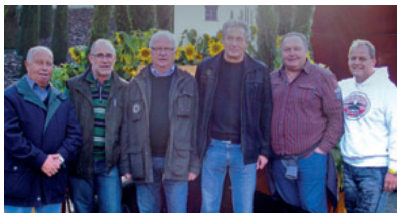
Reisegesellschaft der VB Villach.