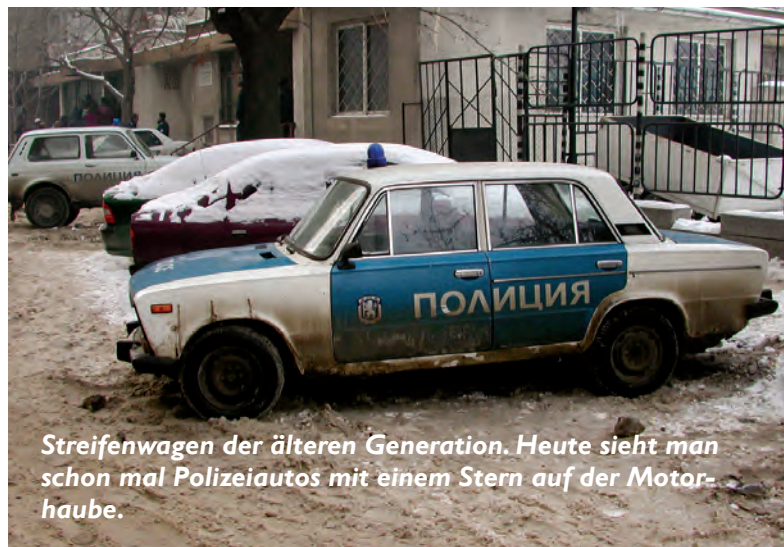
Streifenwagen der älteren Generation. Heute sieht man schon mal Polizeiautos mit einem Stern auf der Motorhaube.

Vor 1990 wurden polizeiliche Funktionen von der „Volksmiliz“ wahrgenommen. Diese Organisation umfasste folgendes: Die Territoriale Miliz, die örtlichen Strafverfolgungsbehörden, die Straßenmiliz, die Autobahnpolizei, aber auch die Staatspolizei, die Miliz, die Wirtschaftskriminalität, Betrug und Diebstahl untersuchte. Dann gab es noch die innere Sicherheitstruppe, die gemeinhin als die „Roten Barette“ bekannt waren. Sie waren eine militarisierete, leichte Infanterieeinheit, die für die Vermeidung von Unruhen und anderen Störungen der öffentlichen Ordnung verantwortlich war. Es waren ca. 15.000 Rote Barette in 15 Regimentern. 1990, nach dem Untergang des kommunistischen Regi-