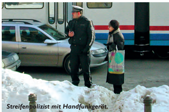
Streifenpolizist mit Handfunkgerät.