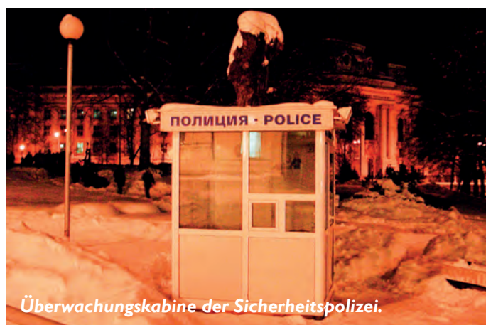
Überwachungskabine der Sicherheitspolizei.

Unter dem kommunistischen System der Polizei gab es Gymnasien, in denen vierzehn Jahre alte Jungen für einen vier-Jahres-Studiengang eingeschrieben waren, um dann bulgarische Polizeibeamte zu werden. Laut Oberst Zlatkov, wurden sie körperlich geschult, technisch und philosophisch. Ein Leben als Jugendliche ging ihnen komplett verloren. „Es war ähnlich wie damals die Osmanen männliche bulgarische Babies ihren Müttern stahlen und sie zu Soldaten ausbildeten. Das alte kommunistische System war vergleichbar mit dem osmanischen System.“ Heute nimmt die Bulgarische National Polizei Menschen auf, die ein Gymnasium absolviert und ihren Wehrdienst abgeleistet haben. Die Bewerber machen einen IQ-Test, ihre sportlichen Fähigkeiten werden geprüft, eine ärztliche Kontrolle wird gemacht und ein Fitness-Test. Ein voller psychologischer Test erfolgt an der nationalen Akademie für Psychiatrie, wo auch ein psychologisches Gespräch geführt wird. Sobald ein Kandidat ausgewählt wird, besucht er eine sechs-monatige Polizeischule.“ Nach drei Monaten gibt es