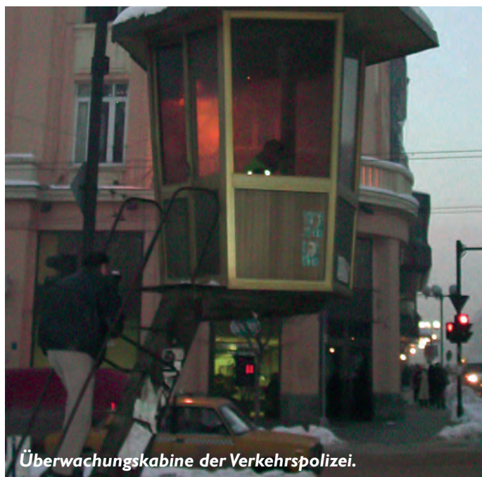
Überwachungskabine der Verkehrspolizei.

für 20 Tage eine Praxisphase. Nach einem Jahr erfolgt ein Schlusstest. Dann wird der junge Polizist zum Sergeant befördert. Laut Oberst Zlatkov ist dieser letzte Test sehr intensiv, sodass manche der Herausforderung nicht gewachsen sind und richtig pauken müssen.