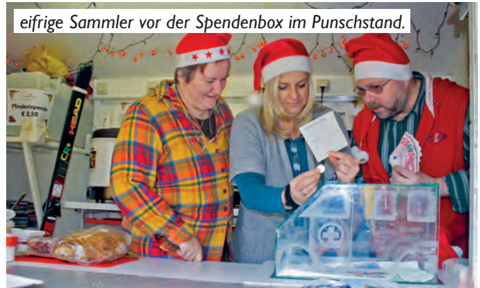
eifrige Sammler vor der Spendenbox im Punschstand.