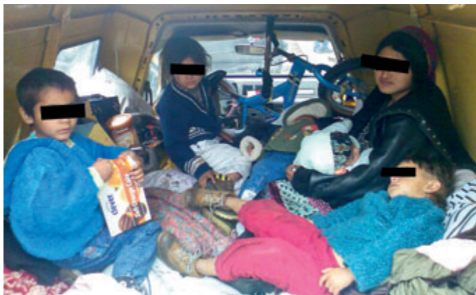
Illegale Grenzgänger, die von einem Schlepper in einen Kastenwagen gepfercht wurden.

len an der Grenze Geschichte geworden. Neue Strategien mussten entwickelt werden, die sich, wie viele Fahndungserfolge beweisen, bewährt haben.