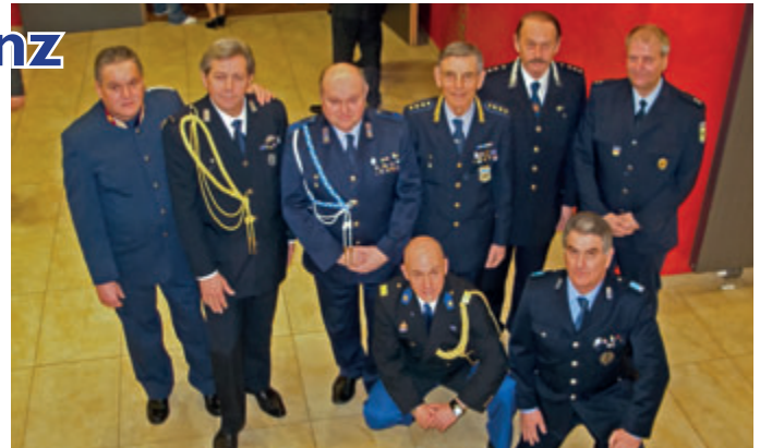
Gruppenfoto der ausländischen Gäste beim IPA Ball in Bruck/Mur-Mürzzuschlag.

Am 28.1.2012, pünktlich um 21:00 Uhr, eröffnete der Ballobmann Klaus Ulrich mit „Alles Walzer“ offiziell den 47. IPA (Polizei) Ball der VB Bruck/M.-Mürzzuschlag. Viele Ehrengäste, vor allem aber viele Uniformen aus verschiedenen Ländern und