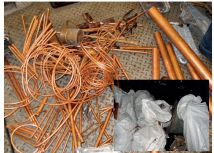
Loses Kupfer wie es von Installateuren verwendet wird und Kupfer in Säcken.

„Für uns ist es nicht nur die Bestätigung unserer ausgezeichneten Arbeit, wir sind auch stolz darauf, wenn unser Gegenüber verlauten lässt, dass Nickelsdorf ein heißes Pflaster ist, das man nach Möglichkeit umgehen