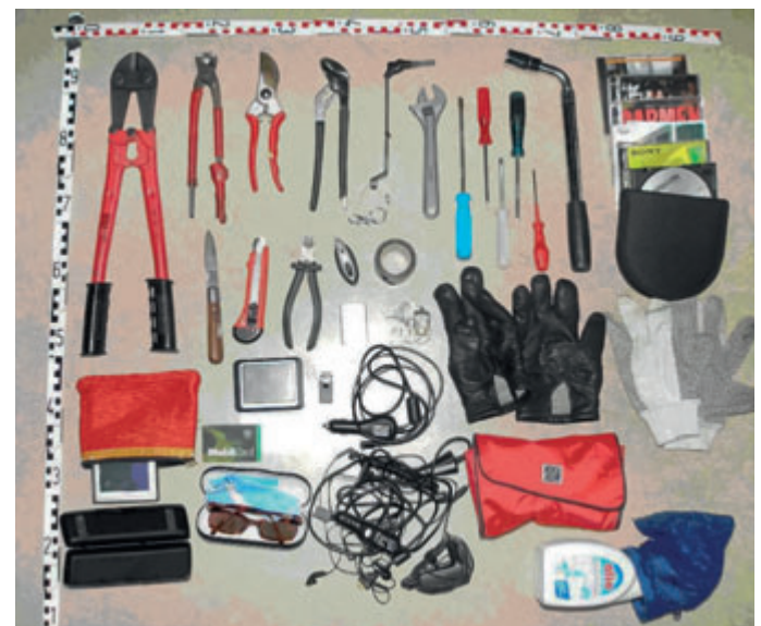
Im Kofferraum eines Fahrzeuges sichergestelltes Einbruchswerkzeug.