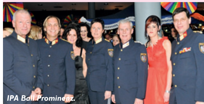
IPA Ball Prominenz.

Am 28. Jänner 2012 fand in den Kultursälen von Wolfsberg der traditionelle Polizei und IPA-Ball statt. Wie schon in den letzten Jahren wurde der Ball von den KollegInnen der Polizeidienststellen des Bezirkes Wolfsberg bestens organisiert und war sehr gut besucht.