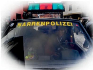
Rechts sorgt die Narrenpolizei für Ordnung.