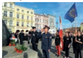
Die Gedenkminute wird von der Öffentlichkeit mit großem Interesse verfolgt. Polizei im Mittelpunkt der Gesellschaft.