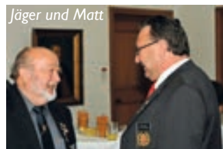
Jäger und Matt

LR Schwärzler eröffnete sein Referat mit einem Dank an die Tagungsteilnehmer, nämlich für ihre Arbeit, die sie in ihren Organisationen für die Sicherheit der Bevölkerung der Bodenseeregion erbringen. Er betonte auch, dass Sicherheit nicht nur Aufgabe der Exekutive sei. Sicherheit geht alle an! Jeder kann seinen Teil dazu beitragen. Im grenzenlosen Europa bedeute