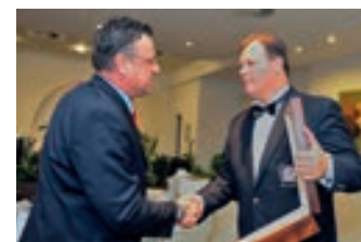
Zu einem Besuch gehört ein Erinnerungsgeschenk aus der Hand des polnischen IPA Präsidenten.