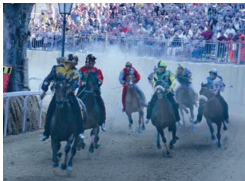
Traditionelles Pferderennen auf ungesattelten Pferden „Palio di Asti“ seit 1275.

Der Höhepunkt dieser Reise war zweifellos das Palio d' Asti. Ein zweistündiger historischer Festzug und im Anschluss das Pferderennen auf 23 ungesattelten Pferden im Wettstreit rivalisierender Subortschaften waren ein großartiges Erlebnis.