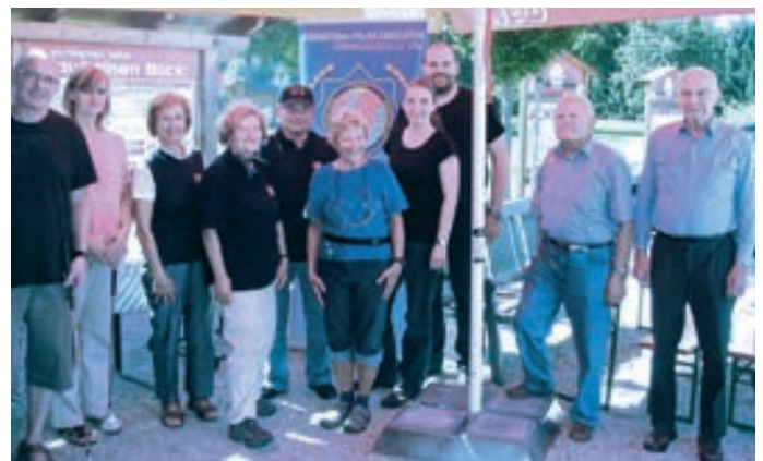
Gäste, Obmann und Organisator.

Ich möchte aber an jene Gäste appellieren, die sich angemeldet haben, aber nicht gekommen sind: in IPA Kreisen erwartet man wenigstens eine Abmeldung. Der Veranstalter hat ja auch für sie eingekauft.