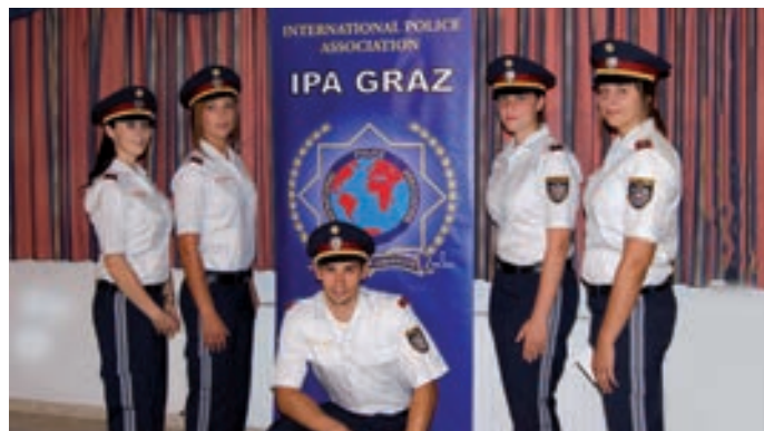
Junge IPA Mitglieder vom BZS Steiermark am Festabend.