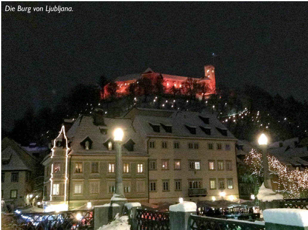
Die Burg von Ljubljana.