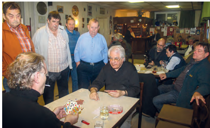
Mit Spannung verfolgen die Kibitze den Verlauf des Preisschnapsens, immer wieder eine spannende Sache.