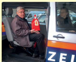
LGO Stammer kümmert sich um die Aktion.

Für die Durchführung der Nikoloaktion bei den Spitälern, St. Anna Kinderspital, AKH Kinderdialysetation, SMZ Ost Kinderabteilung und G. v. Preyersches Kin-