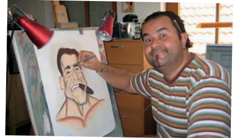
GERONIMO bei der Arbeit – immer gut gelaunt

Eisenstadt: Die LG Burgenland unterstützt bereits seit Jahren ein Hilfsprojekt für Waisenkinder in der rumänischen Stadt Jebuc/Zobok. Zu Weihnachten 2013 gab es wieder eine Lieferung von Schuhen, Toilettenartikel, Bekleidung & Süßigkeiten, die viele Kinderaugen zum Glitzern brachten. Helfen macht Freude – Servo per amikeco!