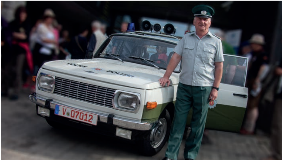
Diese Aufnahme entstand 2009 beim 20jährigen Jubiläum der IPA Vogtland.

Artikel aus IPA aktuell 2/1989 von Jürgen Klös aus Wiesbaden