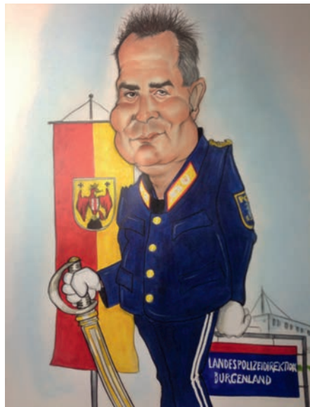
Landespolizeidirektor Hans Peter Doskozil

passenden Präsent suchte. Plötzlich erinnerte er sich seiner zeichnerischen Fähigkeiten, nahm einfach Bleistift samt Radiergummi aus dem „Schulranzen“ seines Sohnes und karikierte den Jubilar. Das Geschenk rief bei vielen Gästen eine derartige Begeisterung hervor, dass er noch am selben Abend einige Aufträge bekam.