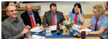
Der Vorstand bereitet die JHV vor