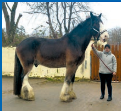
Das Shire-Horse Brandt's GISMO