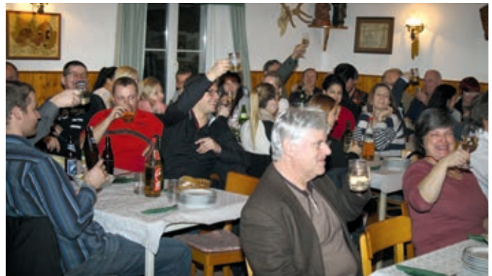
Stärkung der Eintanzgruppe beim Heurigen