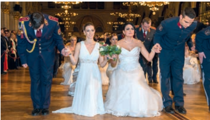
Eintanzgruppe am Polizeiball

den slowakischen Vizepremier und Innenminister Robert Kalinak . Die IPA LG Wien unterstützte den Ball und lud die slowakischen Tänzer zu einem typischen Heurigen ein. Beim Ball trafen sich neben österreichischen, auch IPA Mitglieder aus Kroatien, Deutschland, Frankreich, Finnland und Italien.