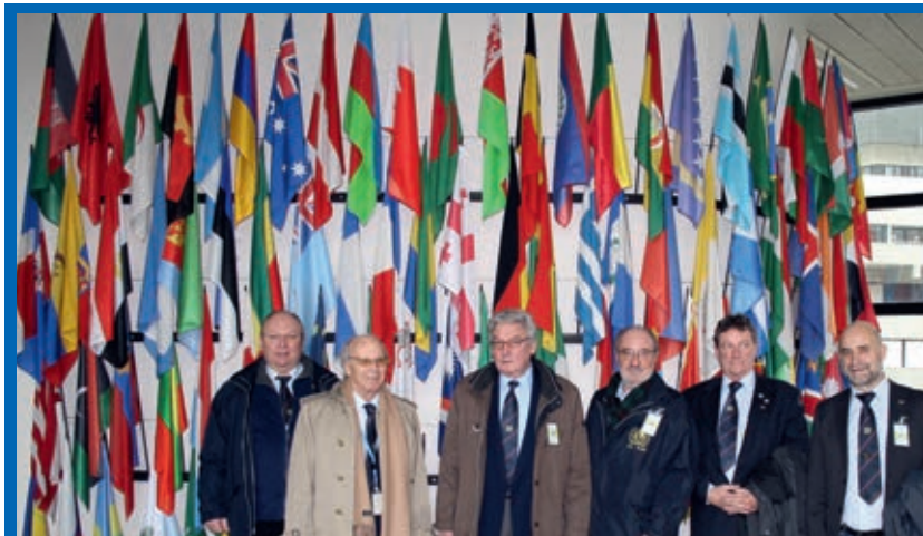
Besuch im Vienna International Center