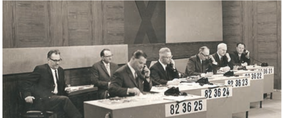
Christ (hinten rechts) bei Aktenzeichen XY.