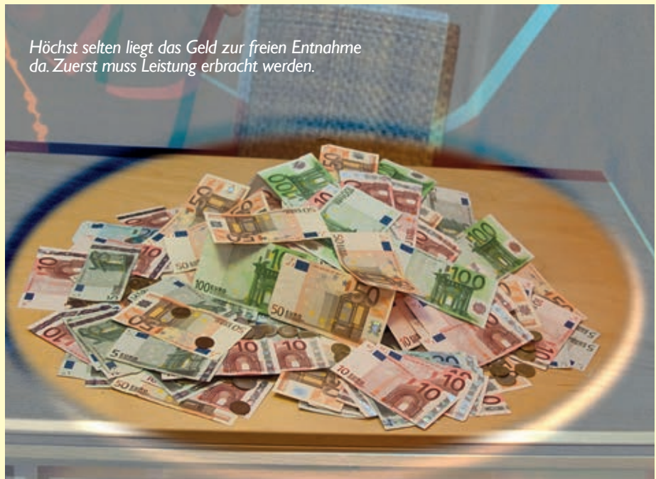
Höchst selten liegt das Geld zur freien Entnahme da. Zuerst muss Leistung erbracht werden.

Der Vierkant-Bauernhof unserer Kollegin Petra H. stand 1,20 m hoch unter Wasser. Die Wohnräume wurden praktisch zerstört (Küche, Bauernstube, Badezimmer etc.) Der pflegebedürftige Vater musste bis zur Fertigstellung im Altersheim untergebracht werden, was