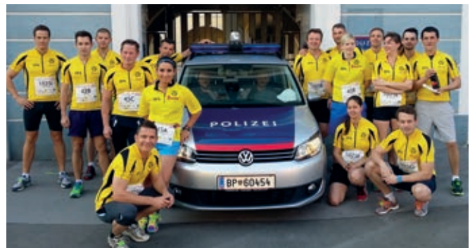
IPA Mitglieder der VB Bruck-Mürzzuschlag

Dienststellen Bruck/Mur, Kapfenberg, BZS Steiermark und EKO Cobra, welche in drei Gruppen starteten, konnten beim Lauf, wo rund 2500 Läufer am Start waren, beachtliche Leistungen erzielen!