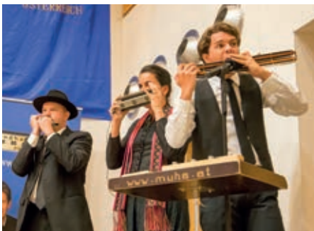
Die Mundharmonikaweltmeister bringen den Saal zum Kochen