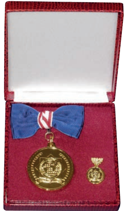
Ehrenmedaillen: © Otto König