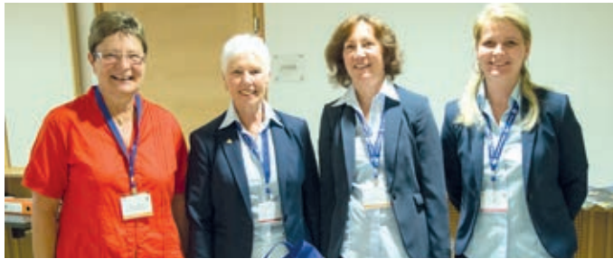
Helpende Hände werden beim Check-in dringend gebraucht.

Ein wichtiger Punkt am Delegiertentag war die Anpassung des Mitgliedsbeitrags. Im Jahr 2002 war er mit € 16,-- festgelegt worden und die letzten 12 Jahre unverändert geblieben. Am dem Vereinsjahr 2015 zahlen ordentliche und außerordentliche Mitglieder € 20,--, Förderer € 40,--. Für dieses Geld gibt es eine ganze Menge, was man auf http://service.ipa.at nachlesen kann. Durch eine konsequent überlegte Vereinsführung kann die Österreichische Sektion sehr moderat ans Werk gehen. Im Vergleich dazu liegt der Jahresbeitrag in Deutschland und Italien bei € 25,--, in der Schweiz zwischen 30,-- und 40,-- Sfr, je nach Region, in Ungarn bei 4.500,-- HUF (ca. € 15,--) und in der Slowakei und in Slowenien bei € 20,--.