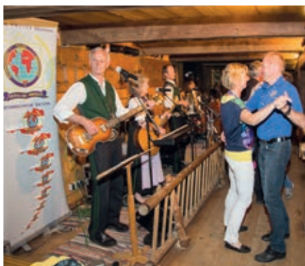
Es darf auch getanzt werden