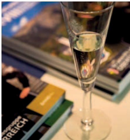
„Für Sicherheit im Lande“ sind Titel und Inhalt der Festschrift