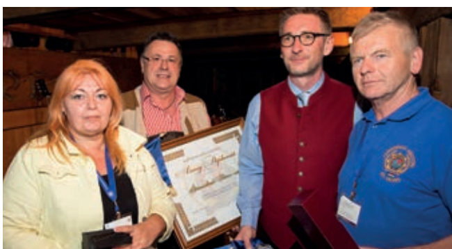
Die ungarische Sektion überreicht die seltene Freundschaftsurkunde zur Erinnerung an die Gründungshilfe durch Österreich vor 25 Jahren