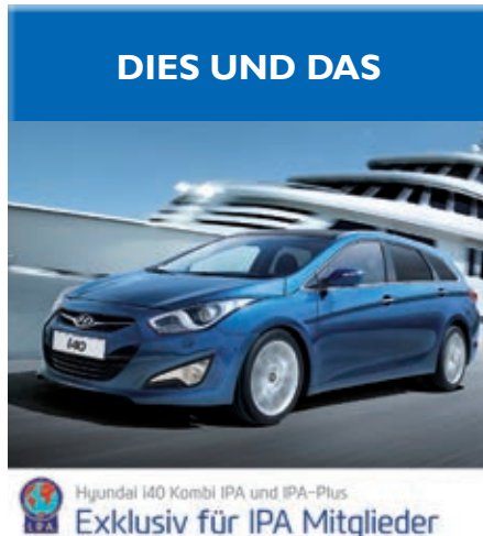
Hyundai i40 Kombi IPA und IPA-Plus Exklusiv für IPA Mitglieder