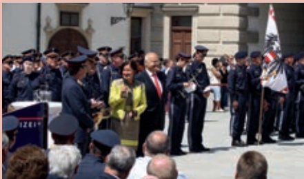
Gute Stimmung bei der Feier