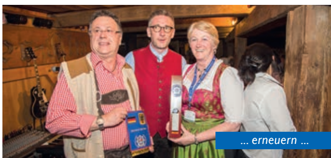
... erneuern ...