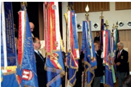
Fahnenbandübergabe in OÖ