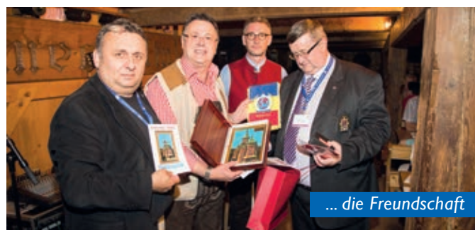
... die Freundschaft

Februar 2014 gestiegen. Ohne einer gesunden finanziellen Grundlage ist eine erfolgreiche Weiterentwicklung und Stärkung unserer Organisation nicht gesichert. In seiner Verantwortung für das Wohl der Österreichischen Sektion stellt der BV diesen Antrag. einstimmig angenommen