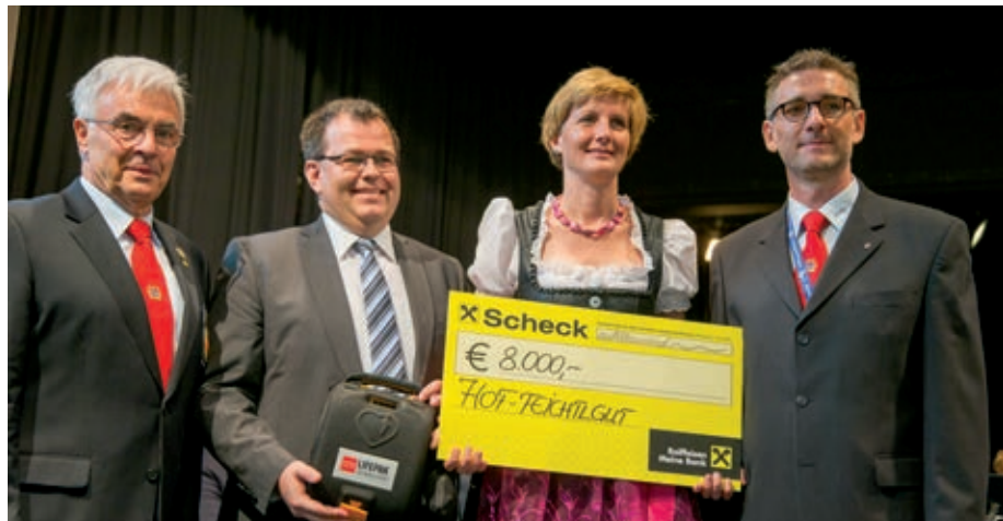
Die IPA Österreich mit ihren LG und VB freut sich, die Sozialeinrichtung Hof Feichtlgut mit € 8.000,- und einem Defibrillator unterstützen zu können