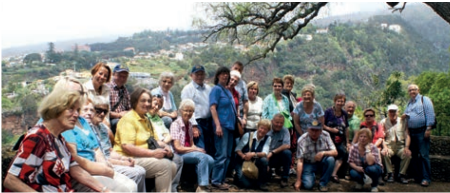
Reisegruppe im Botanischen Garten in Funchal

Eine herrliche Woche mit sehr viel Sonnenschein verbrachten 26 Teilnehmer der VB Linz in Madeira. Diese portugiesische Vulkaninsel erscheint das erste Mal im Jahre 1351 n. Chr. auf einer florentinischen Seekarte. Eine sehr hügelige, abwechslungsreiche, fast tropische Landschaft empfängt den Besucher. Es gibt kaum flache Teilstrecken, die den Menschen die Möglichkeit geben würde, auszurasen. Auch die Maschinen und die Motoren der Kraftfahrzeuge werden immer aufs Höchste belastet. Der Pflanzenreichtum ist fast einzig-