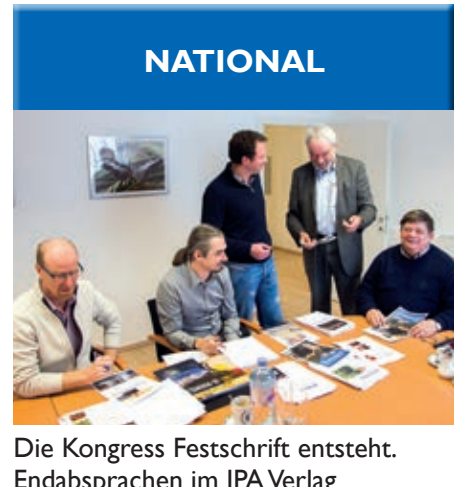
Die Kongress Festschrift entsteht. Endabspachen im IPA Verlag