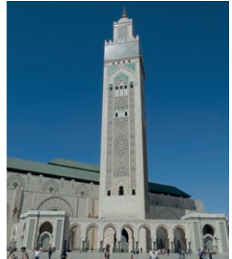
Bild oben: die drittgrößte Moschee der Welt erbaut von König Hassan II in Casablanca