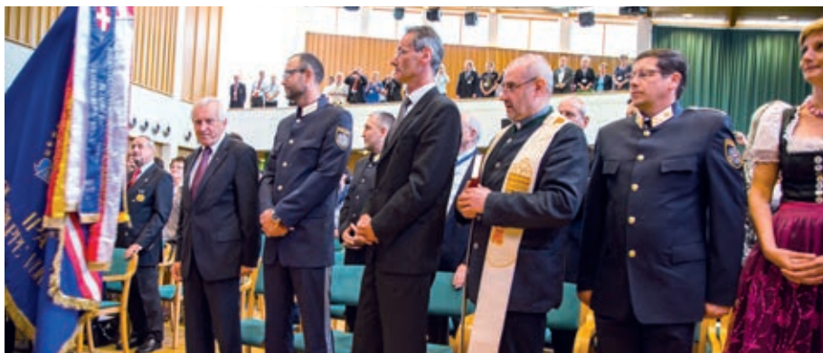
Segnung der Fahnenbänder