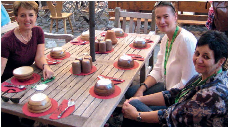
Auch das Begleitprogramm wurde genossen