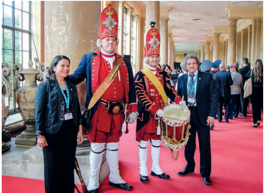
Einzug mit dem Funkenmariechen

Die Zahl der Sektionen hat sich um drei erhöht. Bei diesem Weltkongress wurden Kasachstan, Montenegro, Mazedonien als Vollmitglieder aufgenommen. Die Debatte um das Aussehen der MSC wurde entschieden. Alle Sektionen haben die MSC im Scheckkartenformat mit einheitlichem Logo auf der Vorderseite zu verwenden, die Rückseite bleibt den Sektionen überlassen.