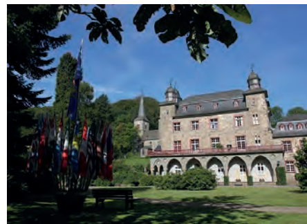
IBZ Schloss Gimborn

ler Tatendrang. Mit einem herzlichen servo per amikeco wünschen wir ihm einen erfolgreichen Start!