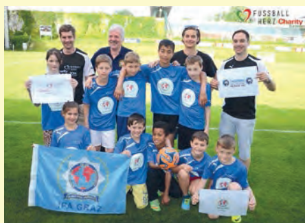
Mannschaft der IPA Graz

Die VB Graz sponserte heuer erstmals eine Kinderfußballmannschaft beim