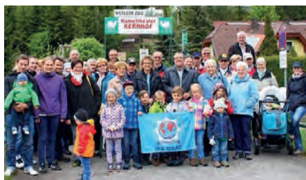
IPA Gruppe beim Ausflug im Tierpark

Mitglieder und Freunde der IPA Graz trotzten wieder einmal dem Schlechtwetter und machten sich auf um in Kernhof (NÖ) weiße Tiger, Schneeleoparden, Serval, Nasenbären, Alpakas, Kamele und einige andere in unseren Breiten seltene Tiere kennenzulernen. Neben den interessanten Details über