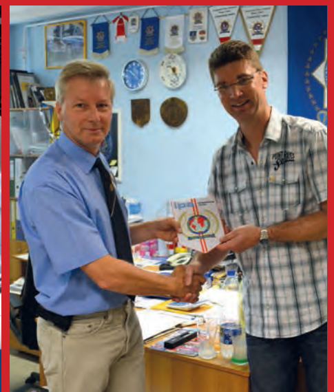
Der österreichische IPA Wimpel wird im Clubraum einen Platz finden