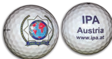
erhältlich in der IPA Boutique, Seite 36

Wr. Neustadt: Am 12. Dezember veranstaltet die VB ihre Weihnachtsfeier. Veranstaltungsort ist das Gasthaus Koglbauer „Koxi“ in Föhrenau. Beginn der Feier ist um 19:00 Uhr. Für den musikalischen Rahmen und für beste Stimmung ist gesorgt.