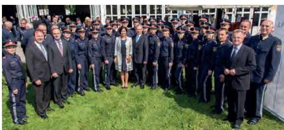
Die ausgemusterten jungen Kolleginnen und Kollegen mit den prominenten Ehrengästen

600 DDR-Bürger in kaum zwei Stunden nach einem Paneuropa-Picknick den Weg in die Freiheit gefunden. Obwohl diese Veranstaltung bereits bis ins Detail geplant war, musste man aufgrund der schlechten Wettervorhersage ins Musikheim der Grenzgemeinde übersiedeln, doch