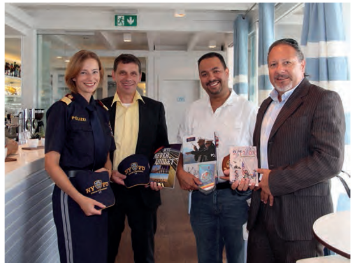
Natürlich wurden auch kleine Gastpräsente ausgetauscht