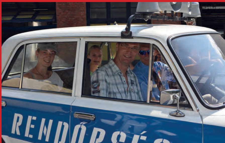
Die Fahrt im IPA-eigenen Polizei-Oldtimer war ein Erlebnis