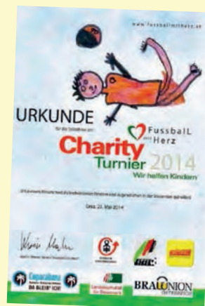
Urkunde des Charity Fußballturniers

ermark sowie die VB Graz-Umgebung eine Mannschaft sponserten, wurde die IPA insgesamt der Öffentlichkeit nicht nur als Verein für Exekutivbedienstete sondern auch als soziale Einrichtung vorgestellt. Neben dem wichtigen karitativen Aspekt zu Gunsten der Steirischen Kinderkrebshilfe ist es dem Vorstand der IPA Graz auch ein Anliegen, mit dem Sponsoring eines Fußballteams einer Grazer Pflichtschule die Kinder bei einem Wettkampf zu spannenden & fairen sportlichen Leistungen zu bewegen und diese zu ermöglichen.