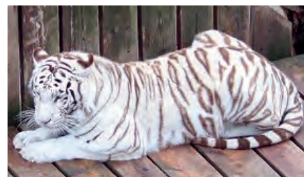
Weißer Tiger im Tierpark

das Leben der Tierarten konnten als lustige Showeinlagen im Tierpark das „Kameltheater“ und die „Bärenshow“ besichtigt werden. Besonders die Jüngsten aus der Reisegruppe hatten ihren sichtlichen Spaß dabei. Diesbezüglich darf erwähnt werden, dass bei diesem Ausflug 14 Kinder zwischen 1 und 8 Jahren mit ihren Eltern und Großeltern teilgenommen haben. „Es ist erfreulich, wenn sich die Kollegen mit ihren Familien einfinden und fernab von Dienstag gemeinsam Spaß haben!“ resümierte der Kultur- und Reisereferent der IPA Graz Alois Losinschek und fügte noch scherzhaft hinzu: „Dieser Ausflug lässt sicher manch andere Veranstaltungen alt aussehen!“