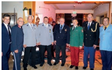
Viele IPA-Freunde in Uniformen aus vielen verschiedenen Nationen, haben der Festgala einen schönen Rahmen verliehen.