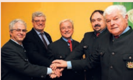
Leibnitz Generalversammlung

Bei den VB änderten sich auch zum Teil die Kontaktadressen. Alle aktuellen Adressen finden Sie auf der Homepage der LG Steiermark.