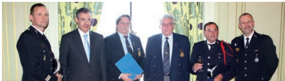
Franz. Botschafter mit seinem Attaché, Schatzmeister LG Wien und die beiden Präsidenten.