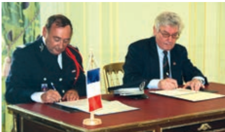
Unterzeichnung der beiden Präsidenten.