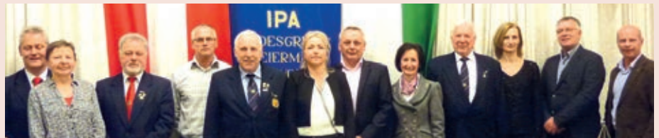
Leoben Neuwahlen