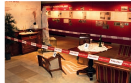
Ein nachgestellter Tatort.

suchtsmorde, Schlepper, Dorftyrannen, Amokläufe und kaltblütige Anschläge, um einen zum Mörder gewordenen Ex-Gendarmen oder einen erschlagenen Viehhändler etc. Da die Besucher einen Einblick in die Arbeit der Polizei bekommen sollen, wurde ein Tatort nachgestellt. Ein Tatortkoffer mit mo-