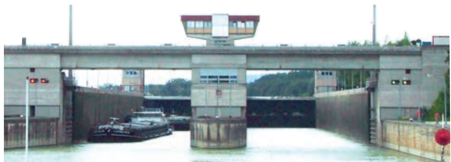
Die Dienststelle hoch über der Schleuse.

Im Rahmen des Verkehrsmanagements ist die mit hoheitlichen Befugnissen ausgestattete Schleusenaufsicht der via-donau für die Verkehrsregelung an den Donauschleusen zuständig. Jedes Jahr werden im österreichischen Donauabschnitt etwa hunderttausend Schiffe durch die neun Donaustaufen geschleust.