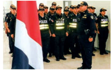
Immer, wenn die Reisegruppe angekündigt war, gab es einen beeindruckenden Polizeiempfang. Diese Kontakte bleiben jedenfalls in Erinnerung.

Tagsüber blieb noch Zeit, die letzten Einkäufe zu tätigen. Am Nachmittag Transfer zum Internationalen Flughafen und Rückflug nach Madrid und weiter nach München bzw. Wien. Eine wunderbare Reise ohne Vorkommnisse, Diebstahl, Verlust, etc., ging im Freundeskreis zu Ende.