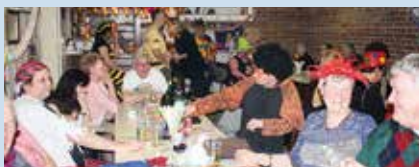
Gschnas 2016 – volles Clublokal