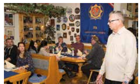
Zu Mittag im Clublokal der IPA-Innsbruck