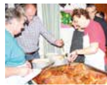
Zur Stärkung der Ballteilnehmer wurde ein Spanferkel aufgeboden