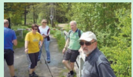
Übertritt nach CZ über die steinerne Brücke