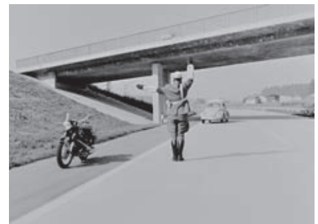
Heute nur noch für Lebensmüde: Stehende Verkehrskontrolle AUF der Autobahn