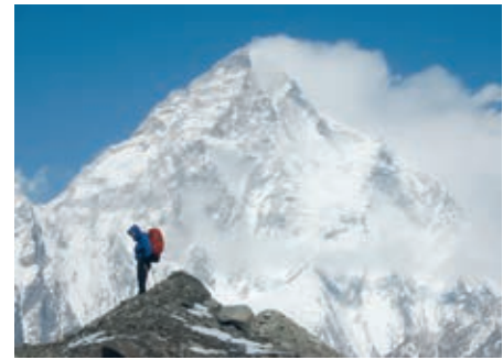
Im Hintergrund der S. Kangri

den knapp 100 kg schweren Patienten abwechselnd am Rücken zum Lager 2 bis auf 5.000 Meter hinunter trugen. Bis dorthin brauchten wir sechs Stunden. Von dort ging es mit einem Maultier weiter bis ins Tal. Enttäuschend für mich war die fehlende Bergkameradschaft (selbst österreichischer Bergsteiger) und die Bereitschaft, einem Verunglückten zu helfen!“