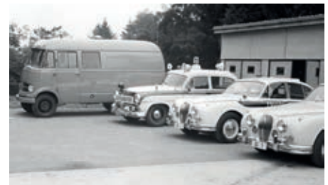
Bescheidener Fuhrpark anno 1959