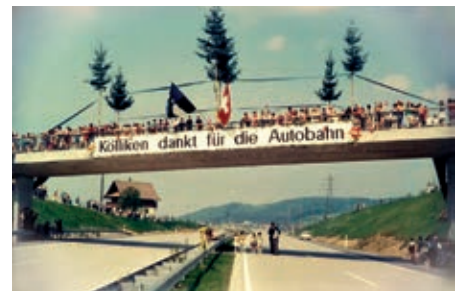
Aufbruch in neue Zeiten: Als die Autobahn noch willkommen war.