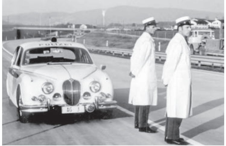
Standesgemäss: Die neu gegründete Autobahnpolizei mit Jaguar-Streifenwagen

Ihren Hauptschwerpunkt setzt die Kantonspolizei Aargau seit Monaten auf die Bekämpfung der grassierenden Einbruchskriminalität. Die Grenznä-