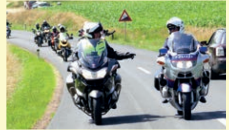
IPA Biker beim MOGO

MOGO (Motorradgottesdienst) teil. Hier wurden € 10.000,- für karitative Zwecke gespendet. Beim Kinderturnier „Fußball mit Herz“ konnte die großartige Spendensumme von € 12.000,- an die steirische Kinderkrebshilfe übergeben werden. Außerdem konnte das von der IPA Graz gesponserte Team der VS Schönau den ersten Platz erringen. Die VS Eisteich (Sponsor VB Graz-Umgebung) erreichte den 3. und die VS Kapfenberg (Sponsor LG Stmk) den 11. Platz. Beim Familienfest des SOS Kinderdorfes wurden von der VB Bruck-Mürzzuschlag den Kindern des von Exekutive und IPA unterstützten Hauses Geschenke für die untergebrachten Kinder übergeben.