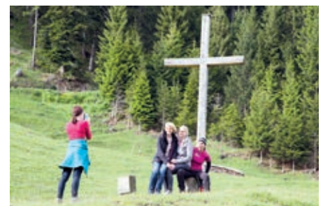
Auf der Alpe Almein

ger und Durst gestillt und ein gemütlicher Abend verbracht.