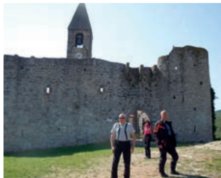
Kirche Cerkev sv. Trojice in Slowenien

Eismeer bis zum Schwarzen Meer. Darüber hinaus erfuhren die Teilnehmer Interessantes über Natur, Geschichte und Menschen der Region. Von der 14 m hohen Aussichtsterrasse genoss die Reisegruppe einen herrlichen Ausblick auf Windhaag. Nach einer dreistündigen Wanderung von Windhaag über die steinerne Brücke in die ehemalige Ortschaft Zettwing (CZ) fand der Familientag bei einer zünftigen Mühlviertler Brettljause einen würdigen und gemütlichen Ausklang.