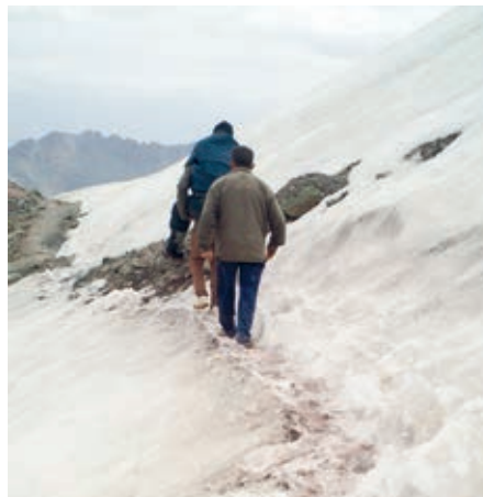
Tragend über Schneefelder und steile nach oben und unten führende Steige, nur Geröll und Platten