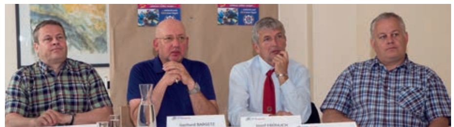
Tripolt, Bargetz, Schweiger, Fröhlich