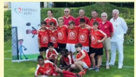
Siegerteam VS Schönau / IPA Graz