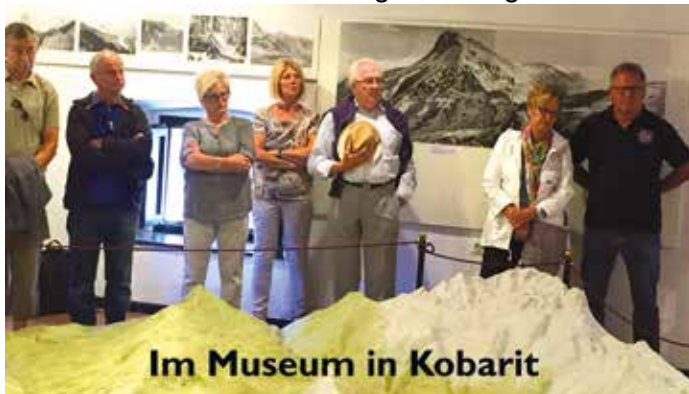
Im Museum in Kobarit