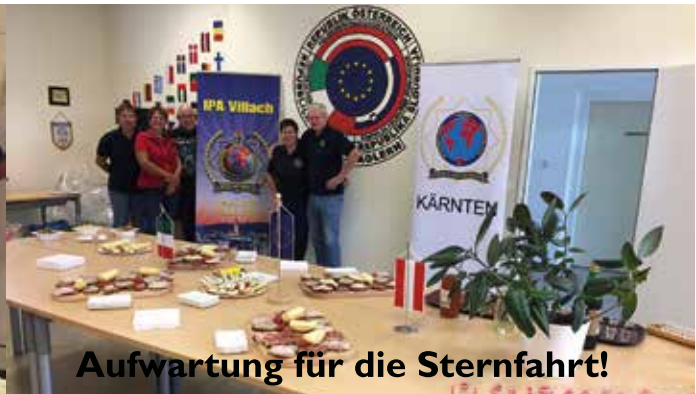
Aufwartung für die Sternfahrt!