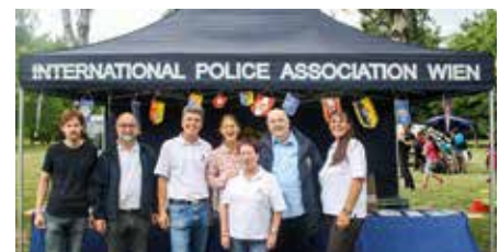
Die Leiterin der Pressestelle Tunst beim IPA Zelt