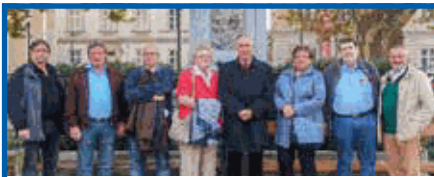
Abordnung der IPA Budapest mit hs Vstd

Ein volles Haus gab es am Donnerstag, dem 04. 10. 2018, beim IPA Wien Oktoberfest im Klublokal, bei Freibier, Brezn und Weißwürscht. Für die Musik und Lichtshow sorgte DJ H. Fraiss. Ein paar Teilnehmer haben glatt die Sperrstunde verpasst.