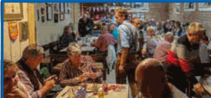
Oktoberfest im Klublokal

IPA Reise Juli 2019: Die schönsten Impressionen der drei baltischen Staaten und Ostseeländer Estland, Lettland & Litauen. Einmal im Leben muss man das gesehen haben. Von Vilnius, der kurischen Nehrung, dem Schloss Rundale, Riga, dem Berg der Kreuze und Tallinn, einfach nicht zu beschreiben. Details auf wien.ipa.at