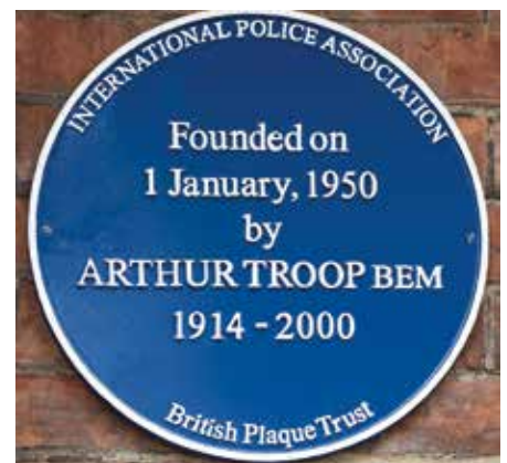
Gedenktafel am IPA-Haus