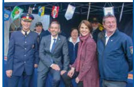
Hochrangige Besucher im IPA Zelt GenSek Goldgruber, Innenminister Kickl, Staatssekretärin Edtstadler

Mit dem IPA Wien Informationszelt beim Tag der Polizei und beim Sicherheitsfest werden mehrere 1000 Teilnehmer direkt kontaktiert. Es werden die IPA Sicherheitsbroschüren in großer Anzahl an die Bevölkerung ausgeteilt. Den Kleinsten bereiten die IPA Luftballone eine große Freude, den größeren die IPA Jojos. Dabei werden auch Netzwerke zu anderen Organisationen der „Helfer Wiens“ gepflegt.