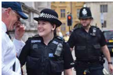
Polizei von Oxford