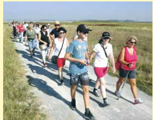
Mit „baumelnder Seele“ durch die unberührte Natur

die Wolken. Die etwa 100 Teilnehmer konnten so richtig die Seele „baumeln“ lassen, Geist und Körper entspannen, Kraft für den Alltag tanken und dabei die einzigartige Vogelwelt des Nationalparks beobachten. Zum Abschluss gab es einen Frühschoppen mit Grillspezialitäten und köstlichen Weinen aus der Region. Für gute Stimmung sorgte „Hannes Top Music“. Der Reinerlös kam der Stiftung „Kindertraum“ zugute.