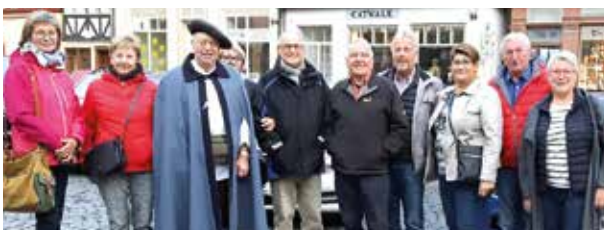
Bei der historischen Stadtführung in Alsfeld

Amstetten-Eisenwurzen: Auf Grund der seit 38 Jahren bestehenden Freundschaft zwischen der VB Amstetten-Eisenwurzen und der VB Alsfeld, Hessen, fuhr eine Abordnung der VB Amstetten am 19. Oktober mit Privatautos nach Alsfeld, um sich, wie alle