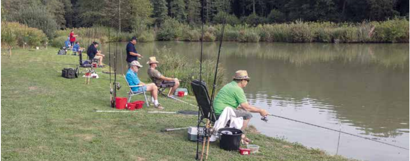
Einfach abschalten und die Schönheit der Natur genießen

Bad Tatzmannsdorf: Polizisten aus dem gesamten Burgenland hatten sich zu den Feierlichkeiten anlässlich des Tages der Polizei in dem bekannten Kurort eingefunden. Zahlreiche Mitarbeiter wurden für ihre hervorragenden Leistungen geehrt. Den Abschluss bildete eine Vorführung der Diensthundestaffel.