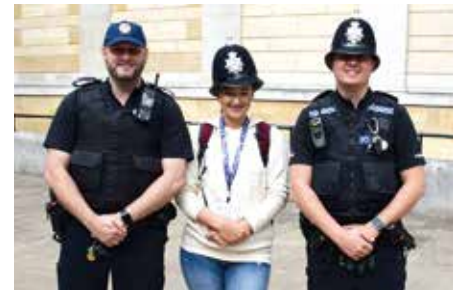
Kappertausch mit Kollegen

Mein persönliches Highlight dieser Reise waren jedoch diese unbeschreiblich liebevollen, netten, offenen und herzlichen Jugendlichen, die aus 25 verschiedenen Ländern kamen, die ich kennen lernen durfte. Ich habe mich mit allen über ihre Herkunft, über ihre Geschichten und über vieles mehr unterhalten und habe dabei manche sehr ins Herz geschlossen. Es war für mich eine großartige Zeit, denn ich habe nicht nur vieles in England gesehen, nein ich habe auf dieser Reise Freunde fürs Leben gefunden, mit denen ich weiterhin in Kontakt bin und auch bleiben werde.