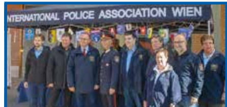
Gäste beim IPA Zelt in der Roßauer Kaserne

Bei der Kalenderpräsentation in der Roßauer Kaserne in einem Festzelt mit etwa 800 Gästen, war eine Abordnung der LG Wien eingeladen. Die hoch professionell durchgeführte Veranstaltung wird lange in Erinnerung bleiben. Die Vorstellung des Polizei Ball-Weines in den Sophien Sälen war ebenso ein unvergessliches Erlebnis.