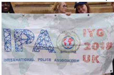
Logo des IYG 2018