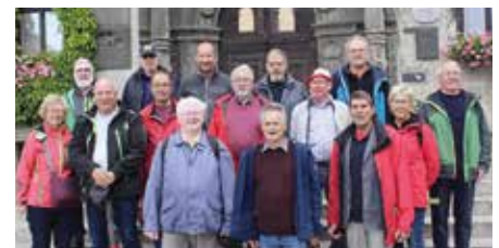
Die Wandergruppe vor dem Kreisverwaltungshaus in Quedlinburg.

Zur diesjährigen Wanderung der IPA-Wandergruppe Alsfeld-Amstetten fuhren die acht IPA-Kameraden aus Amstetten zuerst nach Alsfeld, Hessen, wo man übernachtete und sich mit den dortigen IPA-Freunden traf. Am nächsten Tag ging es dann weiter in den Harz. In den nächsten Tagen erfolgten dann bei sehr schönem Wetter einige ausgedehnte Wanderungen in den Wäldern des Naturparks Harz, wobei auch eine Wanderung auf den höchsten Berg, den „Brocken“ mit 1142 m Höhe, dabei war.