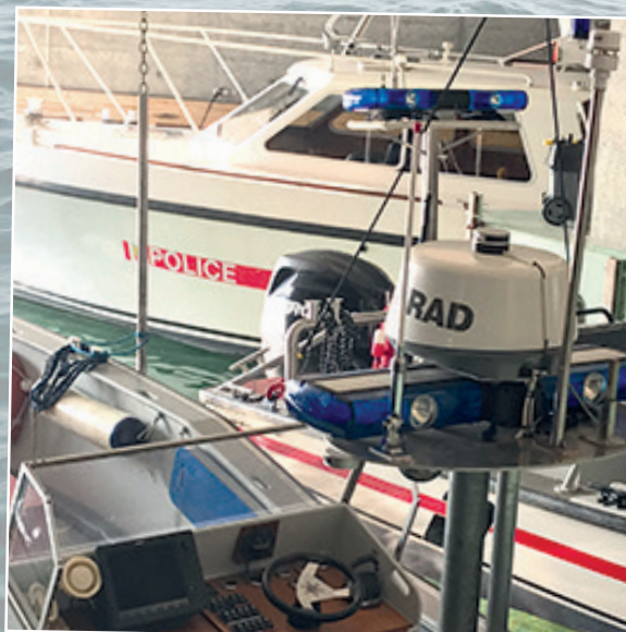
Ein Ausschnitt der Flotte der Seepolizei.