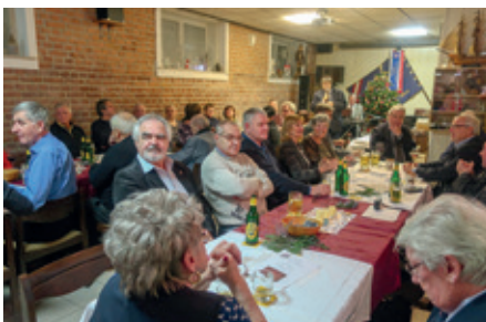
Weihnachtsstimmung im Klub