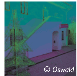
PI Rust

Ins vorweihnachtliche Burgenland führte heuer der Adventsausflug der VB Graz-Umgebung. Gleich mit zwei Bussen reisten