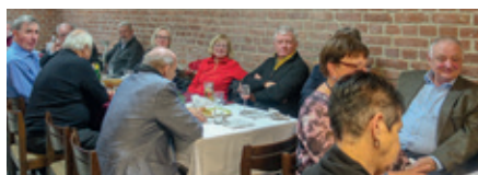
Wiener Blues Stimmung