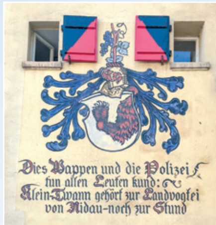
Alte Aufschrift am Gebäude der Seepolizei in Twann.