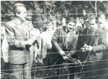
Offizielle Durchtrennung des Stacheldrahtes am 27. Juni 1989 in einem Waldstück zwischen den Gemeinden St. Margarethen und Klingenbach.

Als Ungarn am 2. Mai 1989 bekanntgab, dass man Ende April mit dem Abbau der Grenzanlagen zu Österreich begonnen hatte, nahm die Öffentlichkeit vorerst davon nur wenig Notiz. Nie-