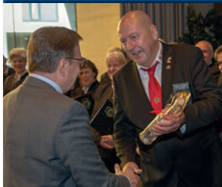
Seite 11 + 29