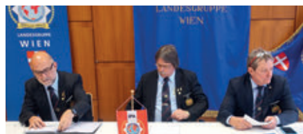
Alter geschäftsführender Vorstand